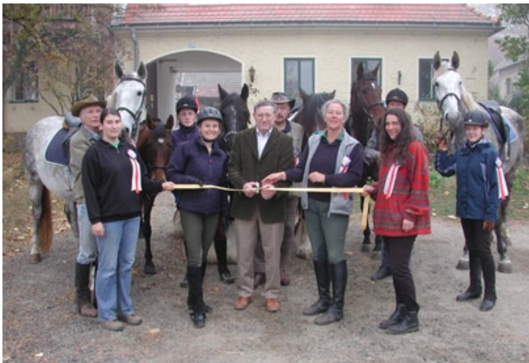
Otevření jezdecké stezky Lichtenberg - Telč

Zkoušený kandidát může být vyloučen zkušební komisí z důvodu podvádění nebo nevhodného chování.